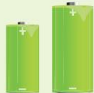
C- en D-batterijen