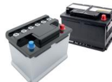
Tractie- en autobatterijen